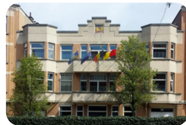
Nouvelle Maison communale (depuis 1949), 140 avenue Charles-Quint (ancienne Radio Conférence). Nieuw Gemeentehuis (sinds 1949), op 140 Keizer Karellaan (voormalig Radio Conférence).