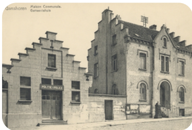
Première Maison communale (jusque 1949), 40 rue de l'église Saint-Martin. Het eerste Gemeentehuis (tot 1949), op 40 Sint-Martinuskerkstraat.

Source : Annales du Cercle d'Histoire, d'Archéologie et de Folklore du Comté de Jette et de la Région - a.s.b.l., 50.2023, Jette 2023 (texte: Albert PIEDFORT).