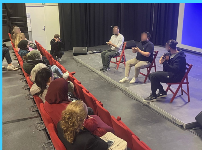
MÉDIATION MEDIATIE @ZEYP