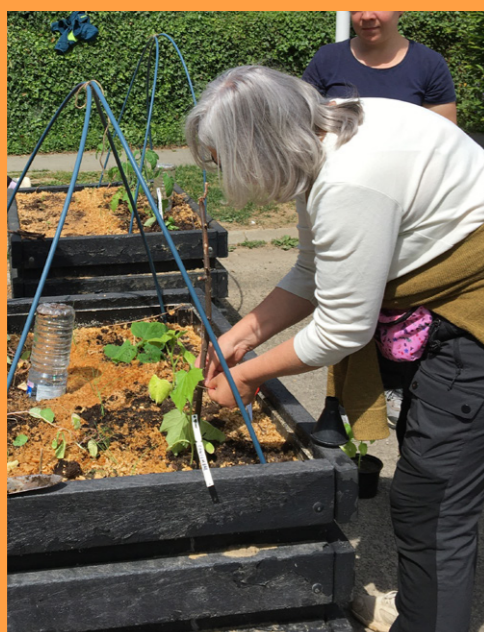
ATELIER MINI-POTAGERS MINITUIN-WORKSHOP

SEMIS DE PRAIRIE FLEURIE BLOEMENWEIDEN INZAAIEN