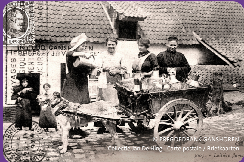
Carte postale / Briefkaarten 3003 - Laitière flamme

★ FR 02 464 05 39 | culture.francaise@ganshoren.brussels NL : 02 464 05 39 | nederlandse.cultuur@ganshoren.brussels