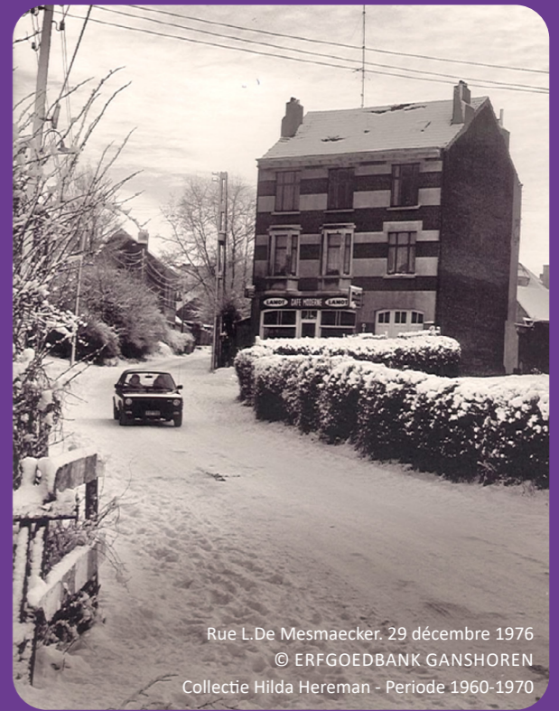
Rue L. De Mesmaecker. 29 décembre 1976 - Période 1960-1970