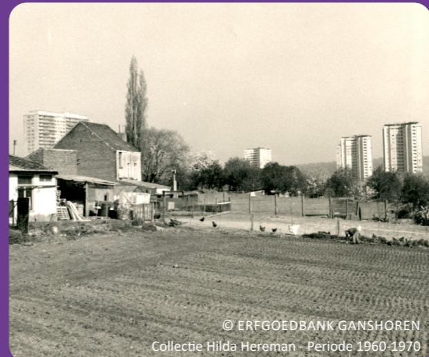
Période 1960-1970