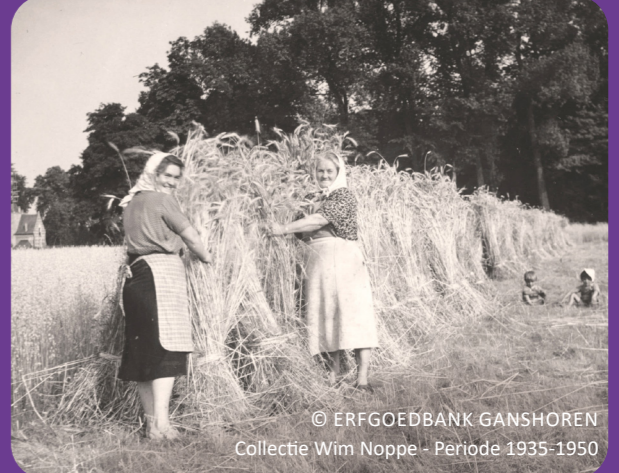
Période 1935-1950