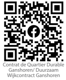
Contrat de Quartier Durable Ganshoren/ Duurzaam Wijkcontract Ganshoren