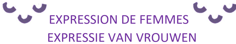
ILLUSTRATION / ILLUSTRATIE

Votre projet en image, photo ou dessin / Je project in beelden, foto's of tekeningen