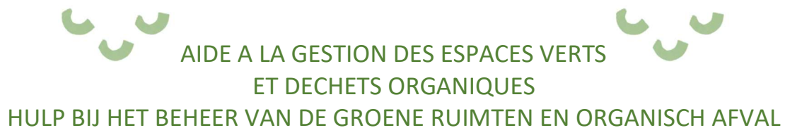
ILLUSTRATION / ILLUSTRATIE

Votre projet en image, photo ou dessin / Je project in beelden, foto's of tekeningen