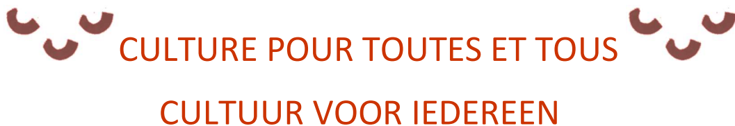
ILLUSTRATION / ILLUSTRATIE

Votre projet en image, photo ou dessin / Je project in beelden, foto's of tekeningen