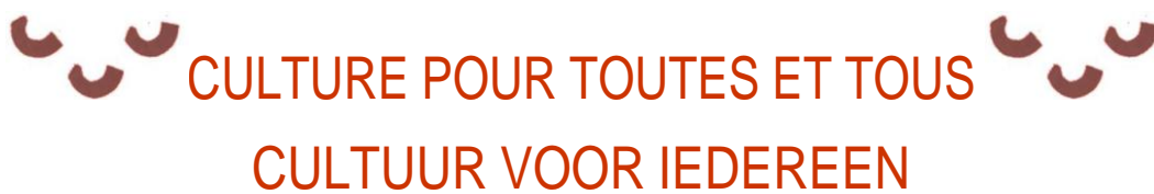
ILLUSTRATION / ILLUSTRATIE

Votre projet en image, photo ou dessin / Je project in beelden, foto's of tekeningen