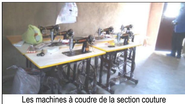
Les machines à coudre de la section couture

Comme en Belgique, le covid a compliqué les choses : confinement jusqu'au 10 août sur Kinazi, puis finalisation et ouverture partielle [mensuels oct. pg. 3].