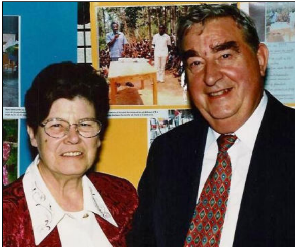
Avec son mari aux 25 ans du Jumelage (1997), devant les photos de Rusatira (action anti-sida)