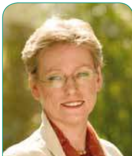
MICHÈLE CARTHÉ / BOURGMESTRE DE GANSHOREN

Quoi qu'il en soit, les fêtes de fin d'année approchent à grands pas : marché de Noël artisanal, dîner de Noël des