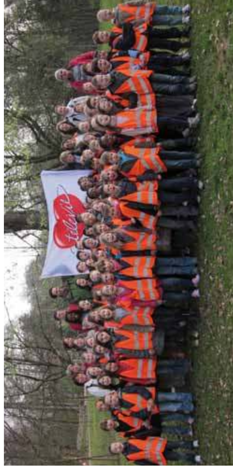
Marche parrainée organisée pour le Télévie par la section primaire du Collège du Sacré-Cœur de Ganshoren Marche parrainée organisée pour le Télévie par la section primaire du Collège du Sacré-Cœur de Ganshoren