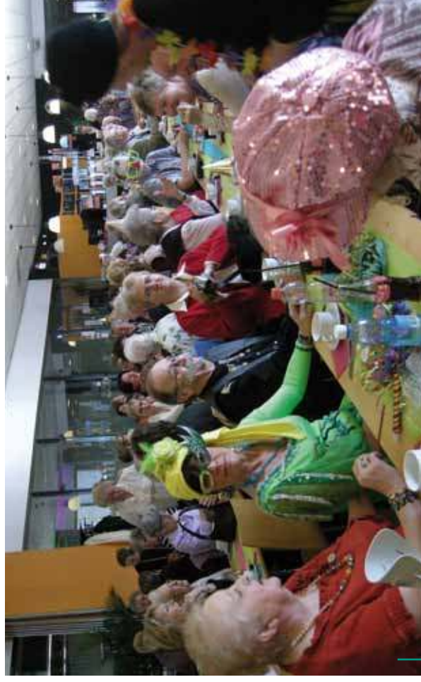
Ambiance de folie au Carnaval des Seniors 2011 ! Ambiance de folie au Carnaval des Seniors 2011 !