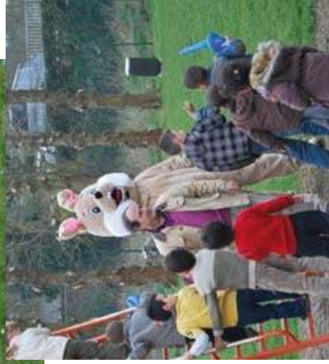
Petits et grands ont ramassé un maximum d'oeufs de Pâques Kinderen en volwassenen hebben zoveel mogelijk Paaseieren opgepakt