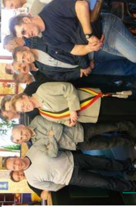
La nouvelle cafétéria entièrement rénovée par les ouvriers communaux a été inaugurée en présence du ministre Emir KIR et des autorités communales De nieuwe cafetaria, volledig hersteld door de gemeentelijke arbeiders, werd ingehuldigd in aanwezigheid van minister Emir KIR en gemeentelijke overheden.