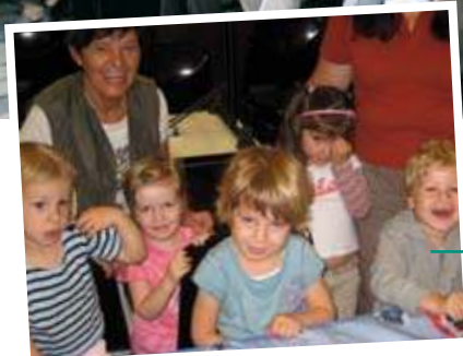
Quelques enfants participants au camp sport et langue pendant les vacances d'été.