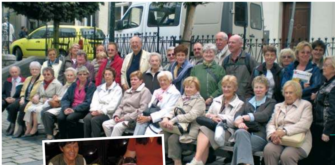
Participants à l'excursion du 7 juin au cœur de Maastrich.