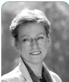
MICHÈLE CARTHÉ / BOURGMESTRE DE GANSHOREN

Comme chaque année, le marché annuel sera le rendez-vous incontournable du mois de septembre. Vous pourrez y flâner en famille et y rencontrer amis, voisins ou collègues. De multiples animations sont prévues et chacun y trouvera son compte : brocantes, manèges, animations musicales, etc. La police sera également présente, en toute convivialité bien sûr, pour effectuer quelques démonstrations et sensibiliser les citoyens au respect des consignes de sécurité. Un "Espace Rencontre" offrira l'occasion