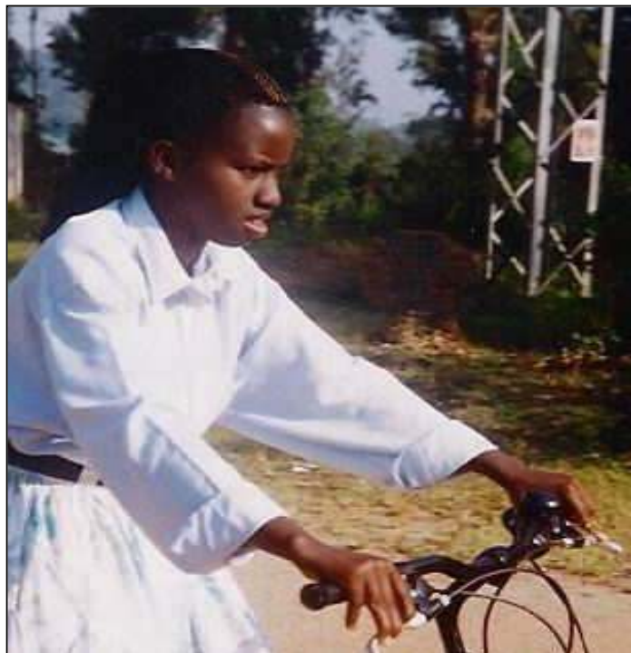
Une «monitrice de santé» soutenue par le Jumelage, parcourt les collines à vélo pour expliquer les campagnes de vaccination, d'hygiène, les mesures anti-sida, etc.

Les monitrices de santé, l'envoi de médicaments marquent le soutien aux droits fondamentaux de l'homme que sont la santé et l'enseignement, commencé en 1972 par la construction du centre de santé avec l'Opération 11.11.11. Le centre a été agrandi (1993-95) et doté récemment d'un bâtiment de soins/maternité pour malades du sida. Une action sociale encourageant les plus démunis à se prendre eux-mêmes en charge, inspirée du self-help d'ATD-Quart-Monde a commencé fin 2004.