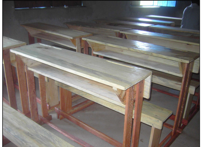
25 pupitres pour l'école de Buremera (nov. 2011)

[NDLR Les bancs pour l'école de Kiruhura avaient été livrés le 19 octobre (voir Jumelage précédent)].