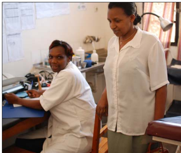
les infirmières du centre de santé de Rusatira (photo Charlotte Demarque – juillet 2009)

Le suivi des femmes enceintes, le suivi de la croissance des nouveaux-nés, le suivi des activités d'assainissement et d'hygiène, la constitution des fiches et des registres de vaccination, la sensibilisation et vaccination des enfants, l'appui et conseil pour la lutte contre la malnutrition, pour la planification des naissances et la lutte contre la pandémie du SIDA.