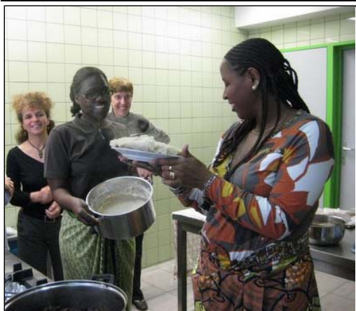
De la préparation ... à la dégustation