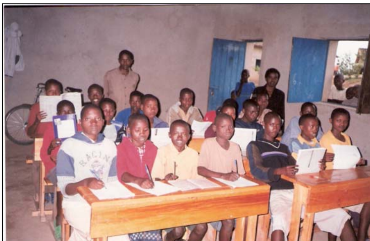
la 6 e année de Buremera (avec le vélo de l'instituteur et bancs de 4 élèves)

Photos de l'école de Buremera [voir ci contre] (avec un devis pour la construction d'une citerne)