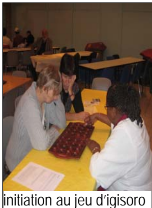
initiation au jeu d'igisoro

Bilan positif. Tous les participants étaient satisfaits et considèrent que l'expérience devra être rééditée.