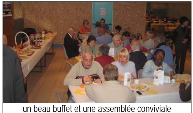
un beau buffet et une assemblée conviviale